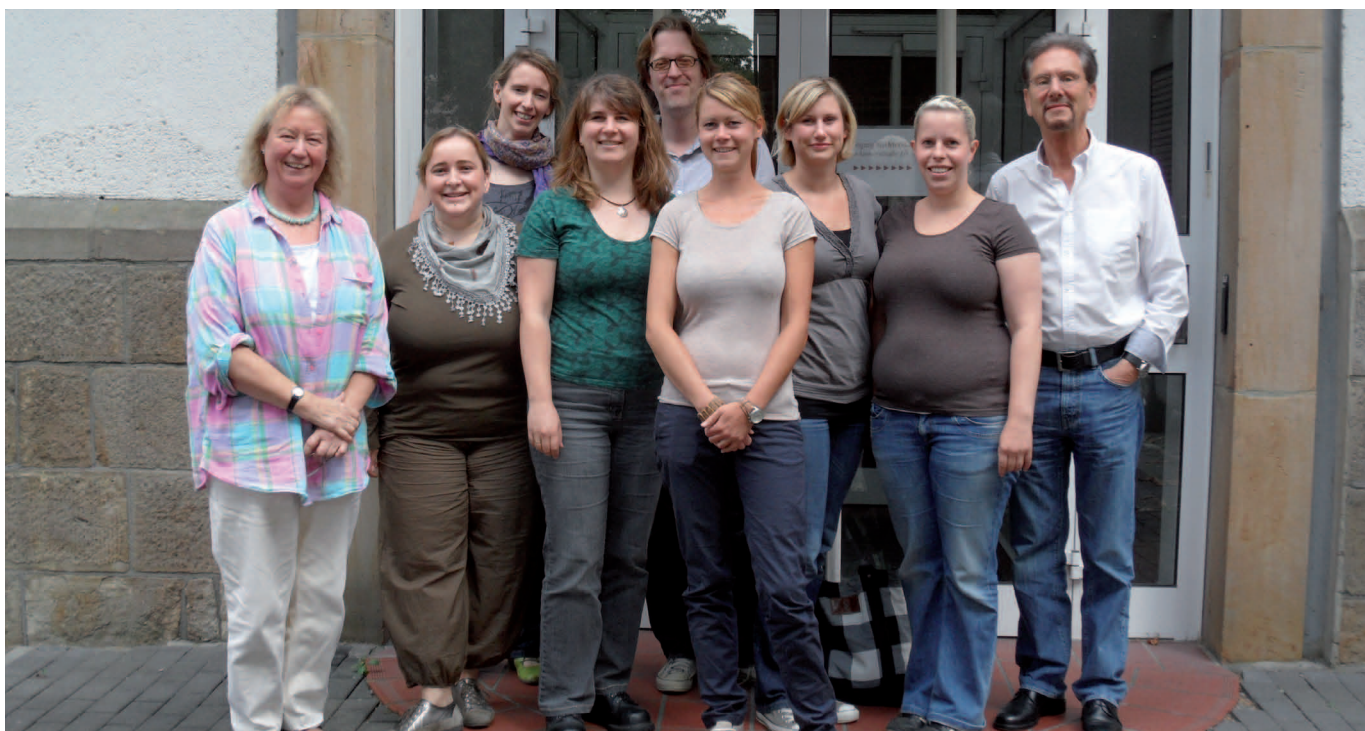
Abb. 2 Die Arbeitsgruppe Wittener Werkzeuge.